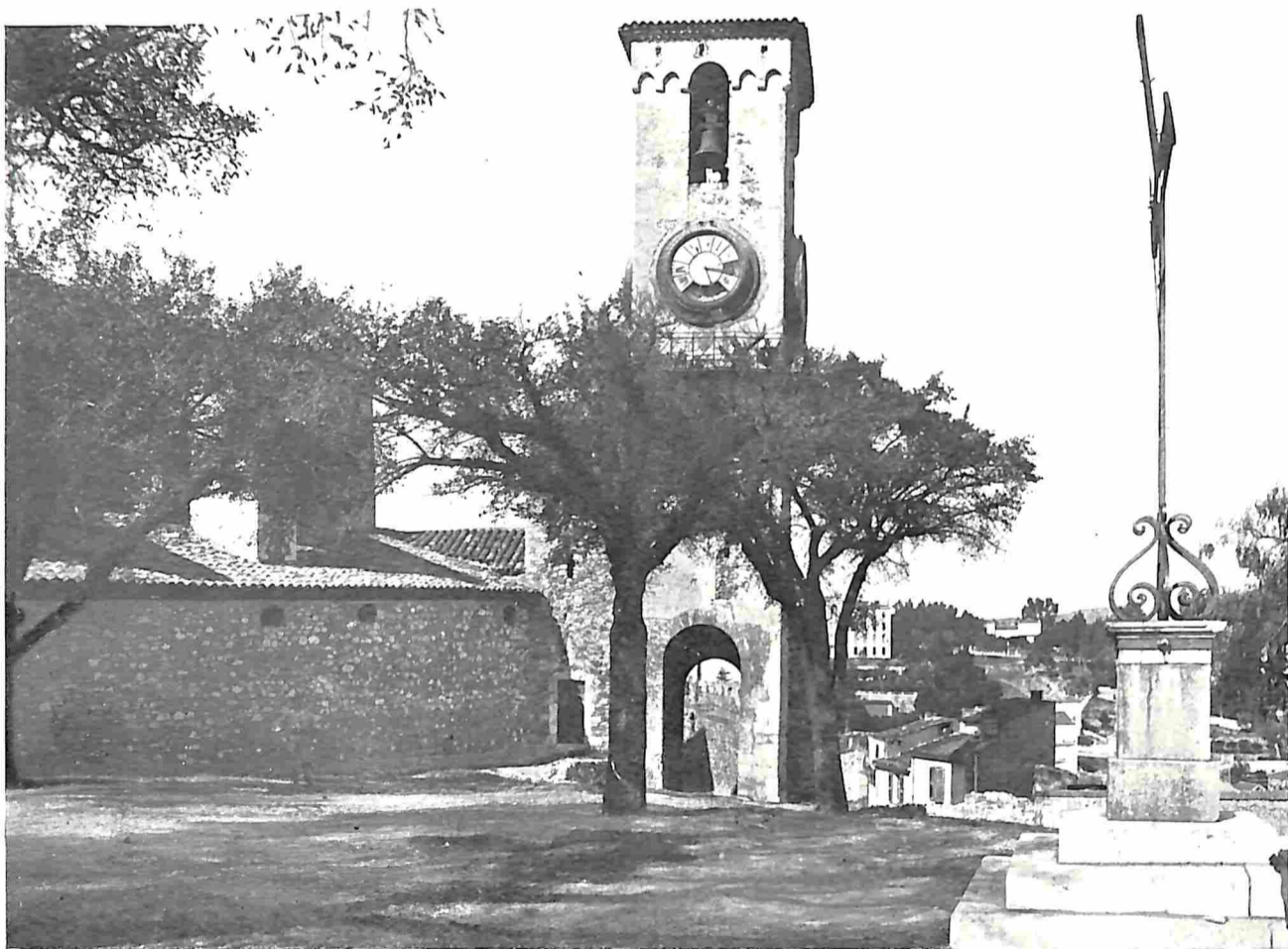
DE XIV e EEUWSCHE KLOKKETOREN VAN CANNES, DE THANS WERELDBEKENDE SUQUET

man Cannes' allereerste „hivernant” werd, — aan het verhaal dus van het ontstaan van „Cannes station-d'hiver”. Dat was namelijk in 1834 . . . . In het sombere jaar 1834, het jaar waarin een vreeselijke cholera-epidemie het noorden van Europa teisterde, en waarin diè landen van ons werelddeel welke tot nog toe van besmetting waren vrij gebleven