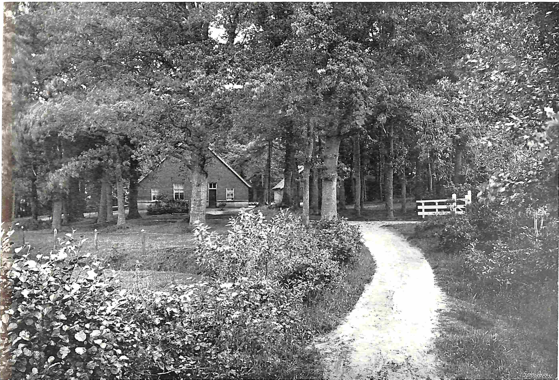
DE LUTTE. HOEVE DUIVENDAL

beeld is. chrysanthemiflorus fl. pl. De Chrysanthbloemige, waar werkelijk wel een extra woordje aan gewijd mag worden. Naam en foto zeggen al alles wat den bloemvorm aangaat. Groot en plat zijn de bloemen, regelmatig gevormd, geheel dubbel, en het eigenaardige is dat de afzonderlijke bloempjes zijn uitgegroeid tot lange, aan het einde wijder wordende en gespleten buisjes, die als schubben of dakpannen over elkander liggen. Ze hebben werkelijk veel weg van Japanse Chrysanthen: de kleur is een echt Zonnebloemachtig helder geel. Prachtig staan zoo'n paar takken met ruige forsche bladeren en zware bloemen in een ruime kamer of hall — in een klein huis worden ze gauw te zwaar en brutaal, tenzij we ze in een groote vaas in 'n hoek zetten. ☼ Buiten worden de planten in goeden grond gemakkelijk 2 meter hoog. Ze vangen dan veel wind en dat moeten we zooveel mogelijk vermijden, door ze beschut te zetten. Want ze wortelen niet diep en vallen gemakkelijk om. ☼ In goed omgewerkten grond zaaien we in April/Mei de groote pitten buiten uit en bedekken ze met een paar cm grond. Alle pitten kiemen en zoo zullen we later wel flink mogen uitdunnen, want als de planten te dicht openstaan, schieten ze te hoog op en verliezen de onderste bladeren. Een ruimte van een goede halve meter is wel noodig, dan