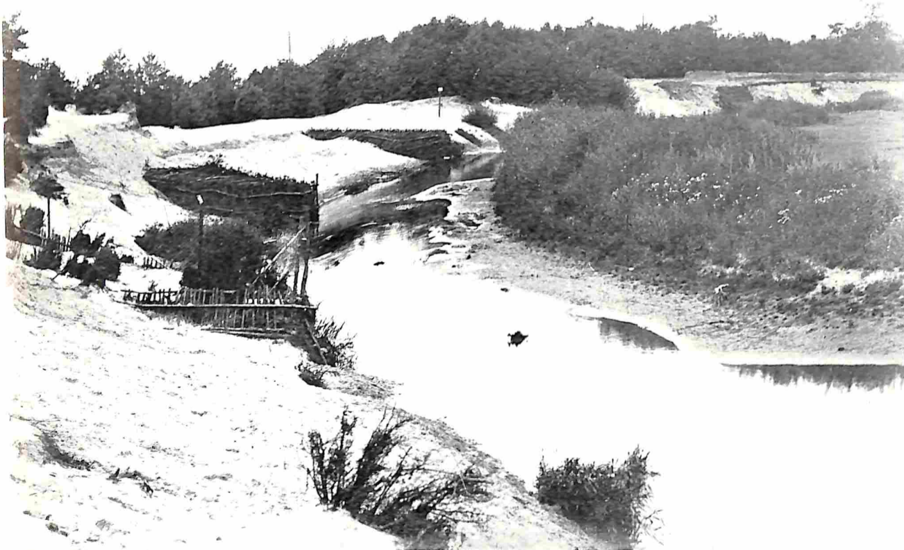
DE DINKEL IN HET LOSSERSCHE ZAND