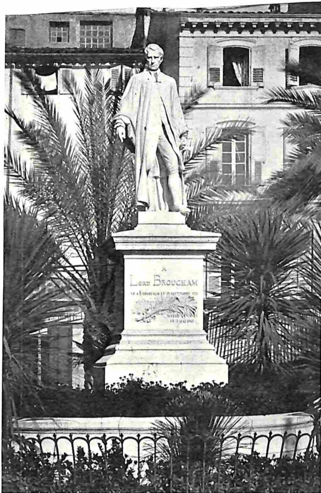
STANDBEELD VAN LORD BROUHAM, CANNES' EERSTEN WINTERGAST

„rendez-vous de la plus haute Société du monde entier”? Ja, veel is er veranderd! En toch, zonder dat dit tot nog toe aan het zoo pittoresk Provençaalsch aspect, èn van het plaatsje, èn van de omliggende campagna, noemenswaardig afbreuk deed. Hetgeen wel tuigt van den goeden smaak harer wintergasten. Harer wintergasten, . . . en ziet! zoo kom ik als vanzelf aan Lord Brougham, en aan het verhaal van hoe deze Engelsch-