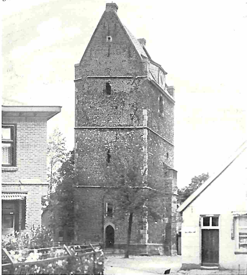
TOREN VAN DE V.M. ST. MAARTENSKERK TE LOSSER (13e EEUW, ZADELVLAK UIT 1667)

drietal boerenerven, het Welpelo, Beernink en Luierman, in het groen tusschen hun kampen en maten verscholen lagen. brak de eenvormigheid der wijde vlakte. De textielindustrie bracht echter verandering in dit beeld; Gronau zoog een stroom van arbeiders naar zich toe, lokte behalve de menschen uit de buurt ook honderden gezinnen uit de arme heidestreken van Drente en Friesland. Gretig werden deze „Friezen” aangenomen in de Gronausche fabrieken, vonden gewoonlijk eerst onderdak in een kamertje bij vrienden of in een boerenschuur, of wel, zij sloegen na enkele weken, als de verdiensten begonnen te komen, een keet op in het veld langs den zandweg naar Losser. Weldra verzezen er ook de eerste steenen arbeidershuizen en zoo is deze vestiging, omstreeks 1890 begonnen, thans uitgegroeid tot een flink dorp. Overdinkel, dat reeds in 1907 zestienhonderd zielen telde.