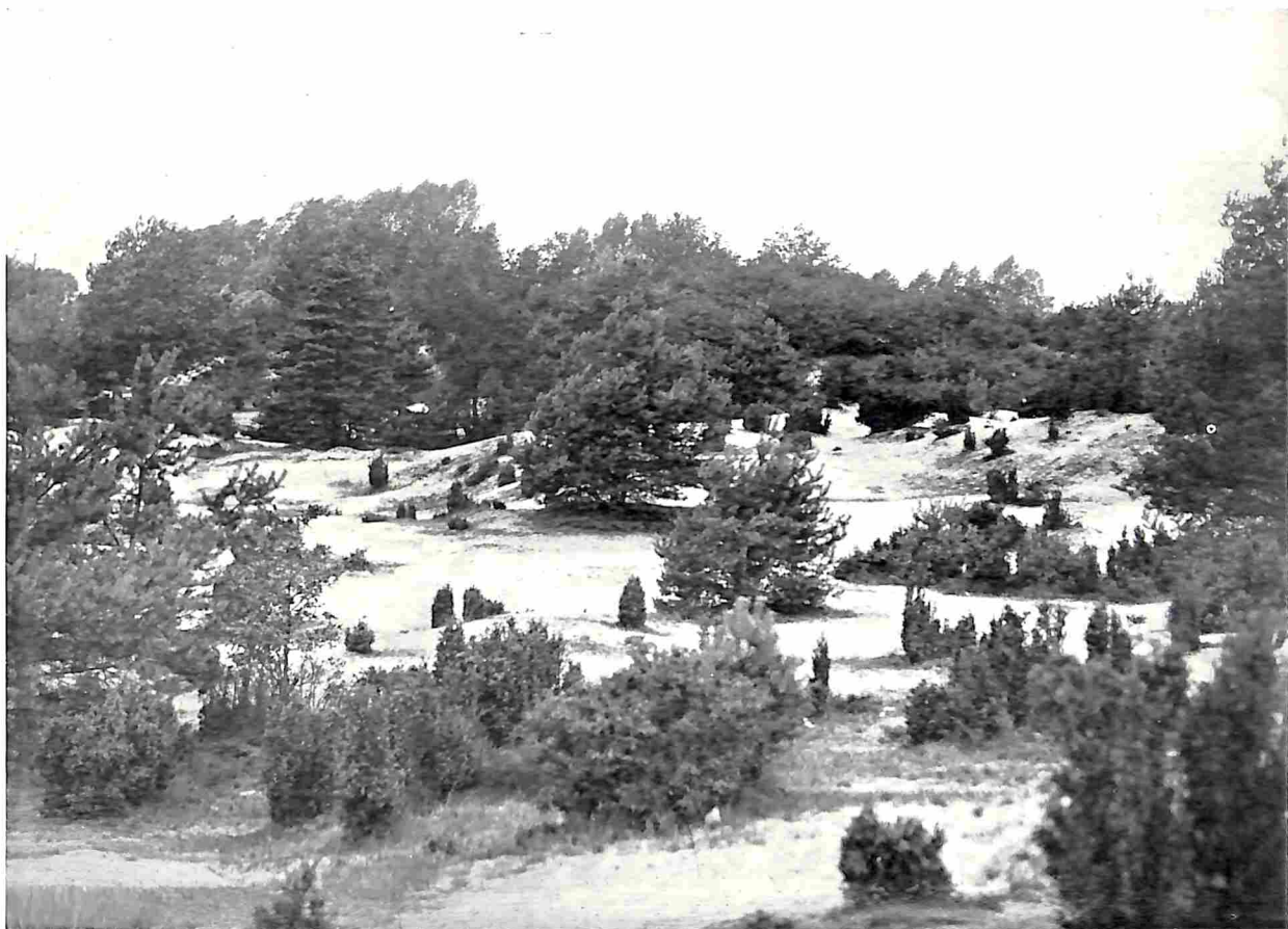
IN HET LOSSERSCHE ZAND

☞ Losser bleef bezet door de bisschoppelijke troepen tot den vrede van Kleef, in April 1666. Collecten werden er gehouden voor het herstel der kerk en den aankoop van nieuwe klokken, die door Jan Fremy gegoten werden, doch de opbrengst liet niet toe, het gebouw zijn ouden luister te hergeven, en daarom neemt men aan, dat het tegenwoordige zadeldak van den toren in plaats van een hooge, veel geld kostende spits kwam. ☞ Het lijkt mij evenwel zeer goed mogelijk, dat óók voor den brand de toren een zadeldak heeft gedragen, evenals tal van torens in het naburige Westfalen, even over de grens, zooals te Alstätte, Ottenstein, Wessum en vele andere dorpen en stadjes in 't Munsterland, waarop Losser voorheen sterk georiënteerd was, getuige de reeks van boerenerven in de marke Losser, die in Westfaalsch bezit waren. ☞ Thans staat de oude St. Maartenstoren alleen. De kerk, die van 1633 tot 1810 in blijvend bezit der heerschende religie was, werd in 1810 op last van koning Lodewijk Napoleon aan de Rooms-Katholieken, die de overwegende meerderheid van zielen vormden, teruggegeven; de toren ging