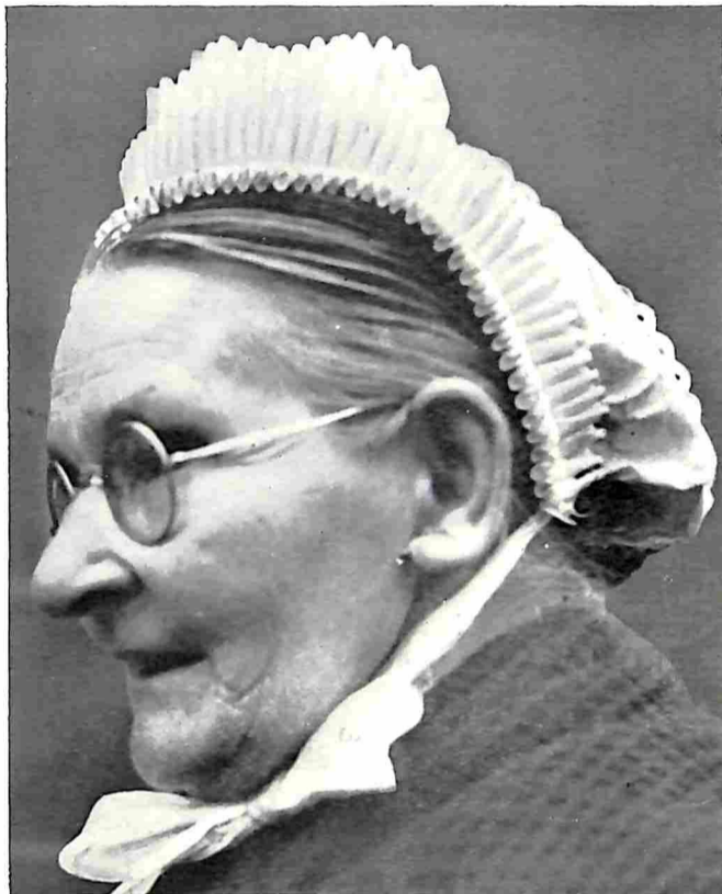
N.-BRABANTSCH E BOERENMUTSENDRACHTEN. DIENSTBODE UIT DEN BOSCH MET HET ZGN. DIENSTBODENMUTSJE

Jonge vogels zouden dus minder aangepast zijn dan de volwassen dieren, evenals de oude. En ook voor soorten zou dit gelden. Het is logisch aan te nemen, dat er even goed soorten en individuen zijn, die blijk geven zich steeds minder goed te kunnen aanpassen; die verzwakken en sterven ten slotte uit (declimatiseeren). ☞ Ten slotte zijn er verschijnselen, die meer van ongunstigen aard zijn: degeneratie- en pathologische. Zoo kwam aan het licht, dat de kans op het mislukken van de legsel periodiek in sterkere mate terugkomt in den loop van het broedseizoen, en dat wel drie maal, namelijk bij de vroegste legsel, de late en eindelijk bij de vervollegsel. Dit gaat met allerlei storingen gepaard: nestbouwen, eieren leggen en broeden tegelijk, het verlaten van het broedsel, eieren worden gelegd vóór dat de jongen van het voorgaande legsel zijn uitgevlogen e.d. Deze storingen kenmerken de zogenaamde legmoede vogels, waarvan een der bekendste nestkastvogels, de pimpelmees, een mooi voorbeeld is. Deze zou de oudste soort van de Parus -familie zijn. Van deze declimatiseerende soort zijn echter lang niet alle individuen in gelijke mate legmoede. Grote verschillen komen voor. ☞ Naast dit alles werden nog enkele belangrijke feiten gevonden wat betreft den samenhang tusschen de leggewoonten en de vegetatie, waarin de vogels leven en broeden. Bij vergelijking namelijk van de verkregen resultaten in naaldhout en loofhout