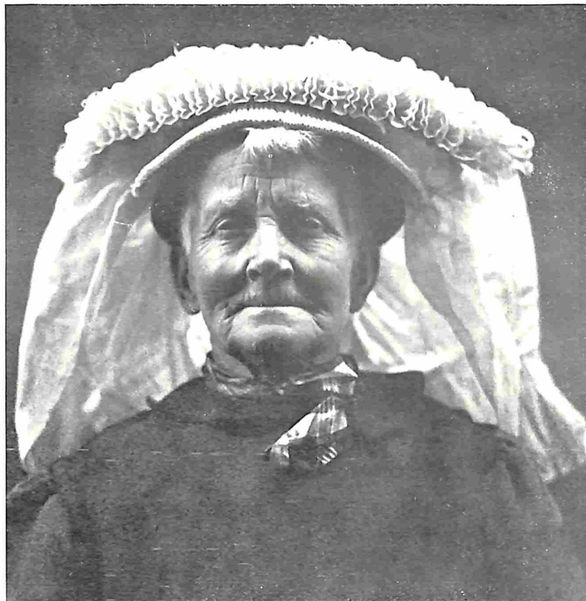
BOERIN UIT NULAND MET POFFERMUTS

klanken van het kerkklokje de geloovigen ter misse riepen, zag ik ze aankomen, de boerinnen uit de Meierij: oude vrouwen en vrouwen van middelbaren leeftijd, bijna allen met de karakteristieke Meiersche mutsendracht getooid. Sommigen van haar droegen kostbare, met fijne kant opgesmukte poffers, anderen weer eenvoudige modellen, en verscheidenen zelfs typische „cornetmutsen”. Door den wind woeien de met fraaie bloemen versierde linten fel op. ☼ Deze drachten sloten zich dan ook wonderlijk goed aan bij het dorpskader van dit idyllisch plekje met z'n middeleeuwsch kerkje en eeuwenoude entourage. (Slot volgt)