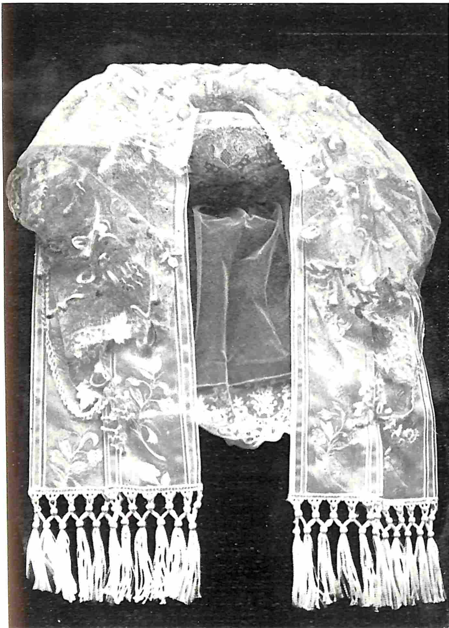
ACHTERZIJDE VAN DE OIRSCHOTSCH E POFFER, DIE RIJK GEBLOEMD IS