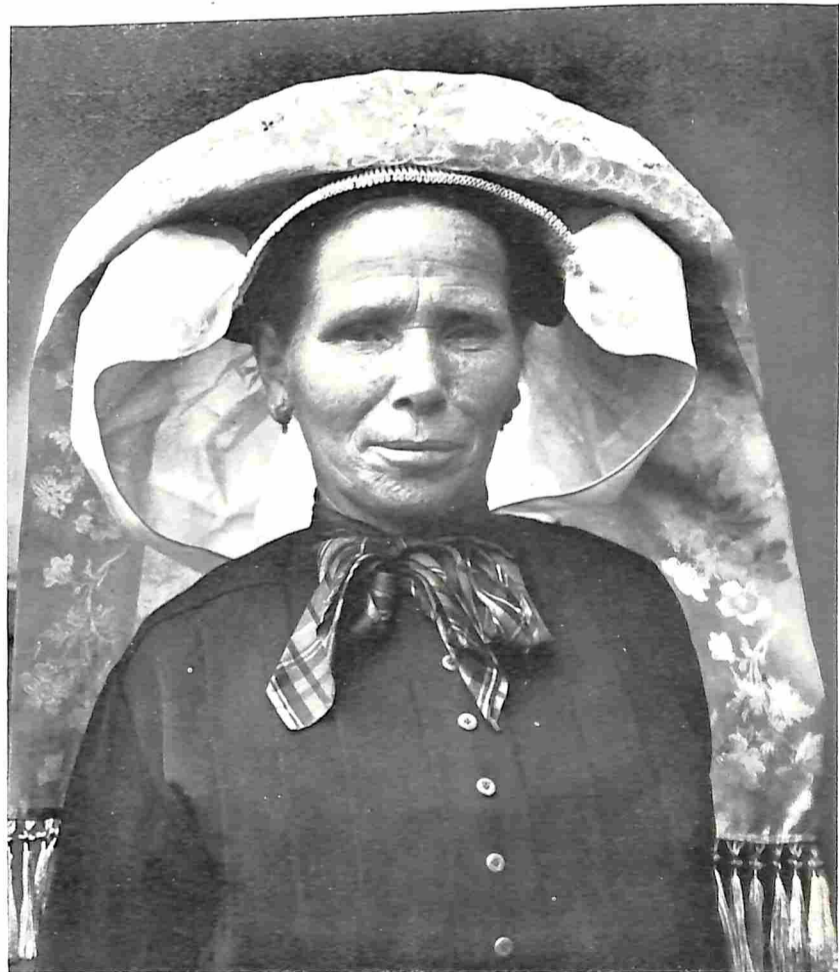
BOERIN UIT DEN DUNGEN IN DE MEIERIJ MET DOOR-DE-WEEKSCHE MUTS