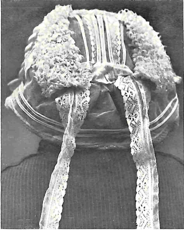
ACHTERZIJDE VAN EEN MUTS UIT VLIJMEN

Niet ver ten noorden van den Bentheimer weg beginnen op den rechter Dinkeloever de uitgestrekte heideheuvels, pijnbosschen en witte zandverstuivingen van het Lutterzand, een streek zoo schoon in haar soort, dat zij in geheel Overijsel haars gelijke niet heeft. Doch den lof van dit uitverkoren gebied te bezingen, blijve voorbehouden aan een volgend artikel.