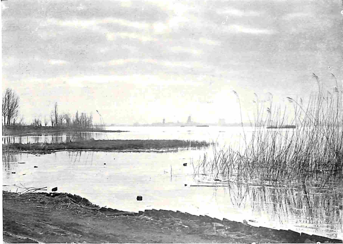
WINTER AAN DEN PLASKANT

ster den toren van Löbenicht kon zien. Hij had zich er aan gewend, bij het denken en bij colleges en redevoeringen altijd een dergelijk punt op te zoeken en daarheen voortdurend den blik terug te wenden. Dit is de oorsprong tot de anecdote, dat Kant eens op een college van zijn stuk raakte toen een der toehoorders, die sedert het begin van het semester een knoop aan zijn jas miste, op een goeden dag ineens verscheen met aangenaaiden knoop!