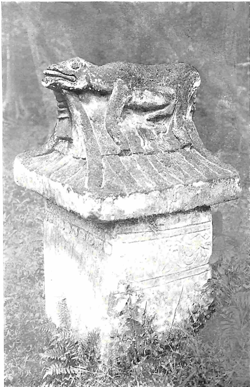
WARUGA MET EEN SOORT KIKKER OP HET SLUITSTUK