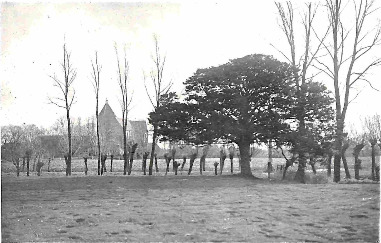
DE OUDE CEDER OP DE WIERDE TE ZEERIJP MET DE KERK OP DEN ACHTERGROND

provincie en elk deel had zijn eigen rechtplaats en hoofd-offerplaats. Op de prachtige kaart van Mr. C. C. Geertsema zijn al die grenzen uitstekend na te gaan en zij is een waardevol hulpmiddel bij het reconstrueeren der geschiedenis der prov. Groningen.