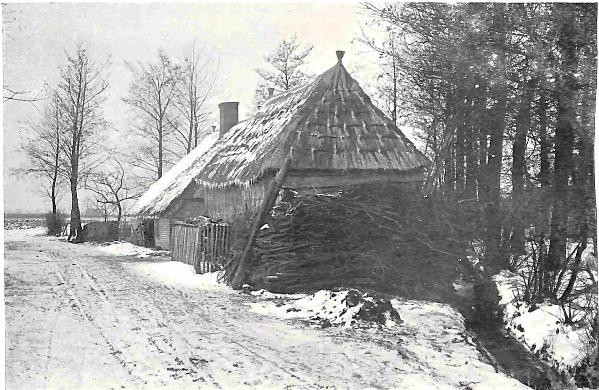
EN AAN DEN BOSCHRAND

ster den toren van Löbenicht kon zien. Hij had zich er aan gewend, bij het denken en bij colleges en redevoeringen altijd een dergelijk punt op te zoeken en daarheen voortdurend den blik terug te wenden. Dit is de oorsprong tot de anecdote, dat Kant eens op een college van zijn stuk raakte toen een der toehoorders, die sedert het begin van het semester een knoop aan zijn jas miste, op een goeden dag ineens verscheen met aangenaaiden knoop!