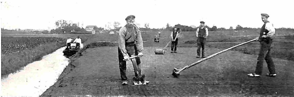
HET ROLLEN, VERDEELEN EN STEKEN VAN DEN BAGGER

Macquartbouquetten die — o schrik — met glans drie voor-en najaarsschoonmaken plachten te overleven! ☒ Die moderne winterbouquetten bestaan ook. Men kan ze samenstellen uit grassen, bloemen of vruchten. Om met de grassen te beginnen: het allerbeste leenen zich hiertoe Lagurus ovatus (Hazestaartje), Briza maxima (Groot Suddergras) en Agrostis nebulosa . Het Hazestaartje is een gras dat met donzige pluimpjes op fijne stengels bloeit. Briza maxima heeft helderbruine, schubachtige bloemaren, die aan fijne stengels van den hoofdtak neerhangen en bij de geringste aanraking trillen. Agrostis tenslotte is heel fijn van bouw, de aartjes en stengels zijn op zichzelf nauwelijks op te merken, maar eenige planten bijéén vormen een fijn-doorzichtigen sluier van bruin-