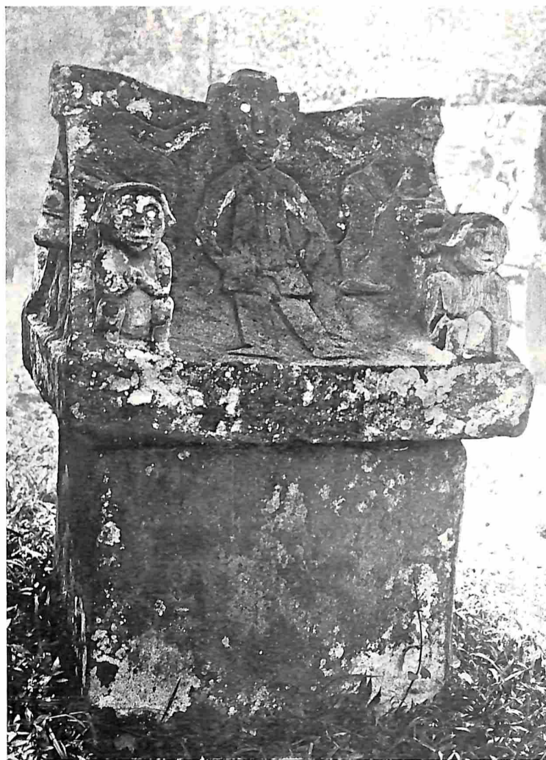
WARUGA MET ZITTENDE FIGUREN

WARUGA OP HET KERKHOF TE MAOEMBI DISTRICT TONSEA) TUSSEN MENADO EN KEWA