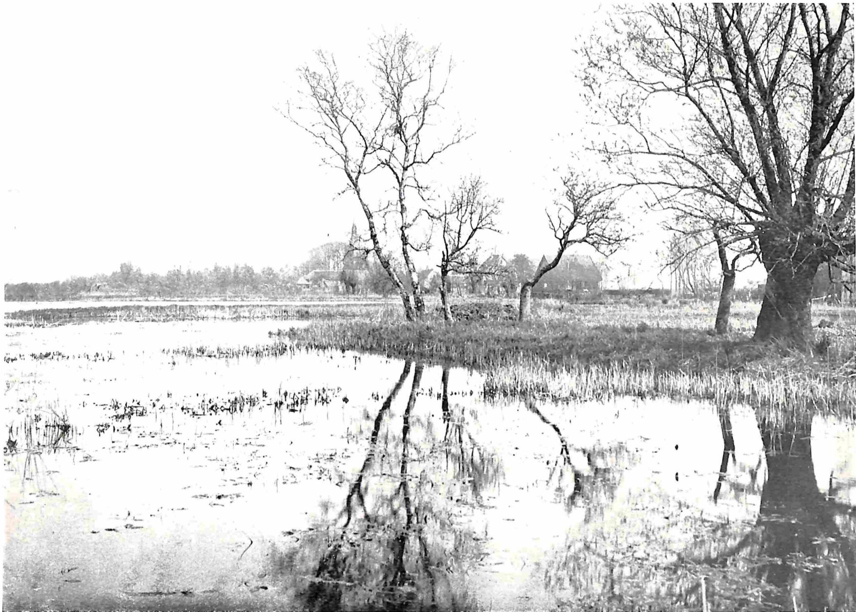
AAN DE PLASSEN TUSSCHEN GOOI EN VECHT