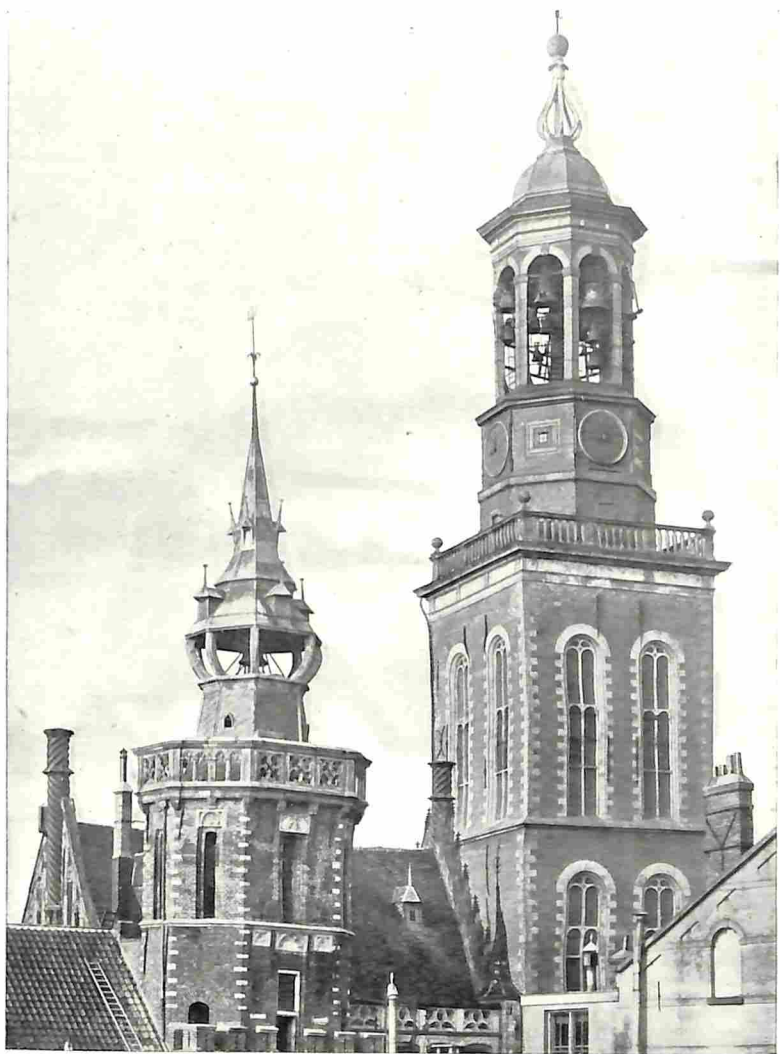
DE NIEUWE TOREN TE KAMPEN. LINKS DE SCHEPENTOREN VAN HET STADHUIS.

¶ Vingboons, die behalve den gevel van het Raadhuis te Deventer, geen ander werk voor een publiekrechtelijk lichaam heeft gemaakt dan Kampen's Nieuwetoren, heeft met dit, zijn grootste bouwwerk, ons een monument nagelaten, dat kunsthistorisch ongetwijfeld een belangrijke plaats inneemt. Want, torens van dezen omvang, uit het tijdperk der late Renaissance, toen de Barok al aanvoelbaar was, zijn er weinige. De Wijnhuistoren te Zutphen herinnert ons aan Kampen's Nieuwetoren, maar overigens komen monumenten van dien omvang en in dit karakter niet veel voor. En degene, die in het altijd nog fraaie silhouet van Kampen-