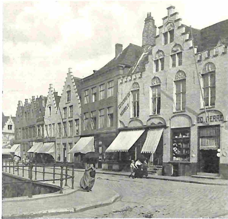
ROZENHOEDKAAI TE BRUGGE.