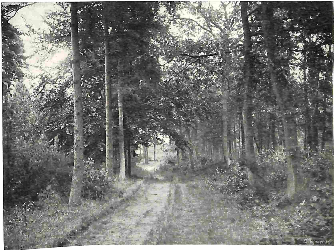
LAANTJE BIJ OISTERWIJK.

laan en van zoo menig andere laan die ons land nog rijk is? Hoevelen is het Leuvenumsche, het Deldensche, het Ruurloosche of welk ander bosch ook, geen openbaring, geen goddelijke troost of verzachting van veel werelds leed geweest? Hoevele kunstenaars en filosofen deden er hun inspiraties op voor hunne werken om de menschen meerdere klaarheid en begrip bij te brengen? Zijn niet onze mooie kathedralen — wij denken hier ook aan die in het buitenland — geïnspireerd door de zuilenrijen van boomen in onze lanen en bosschen, en geven veel mooie, intieme plekjes in onze bosschen ons geen voorbeeld van onze huiselijke interieurs, een model