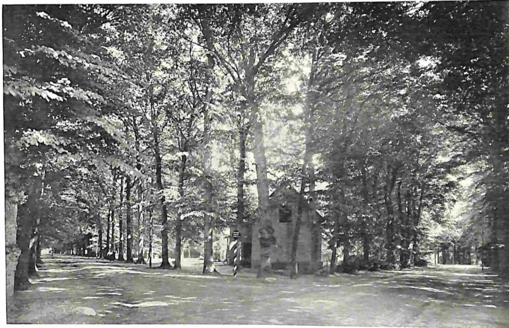
LANEN BIJ GROENEVELD (BAARN).