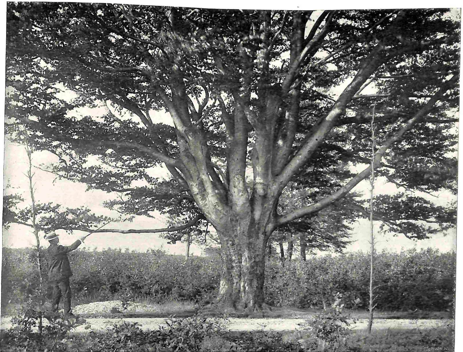
OUDE BEUK BIJ RHENEN.

roofd aan het nageslacht, dat ook recht heeft op de schepping der natuur en op de vruchten van den arbeid onzer voorgangers.