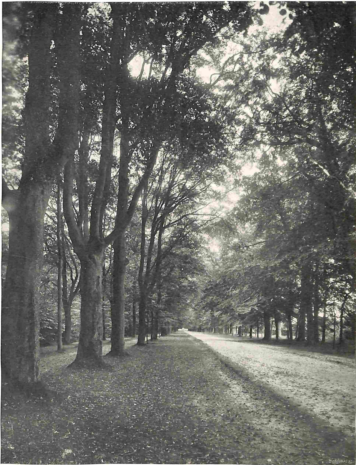
BOOMEN, LANEN EN BOSSCHEN. DE KONING WILLEMSLAAN TE BAARN, IN 1921 GEKAPT.