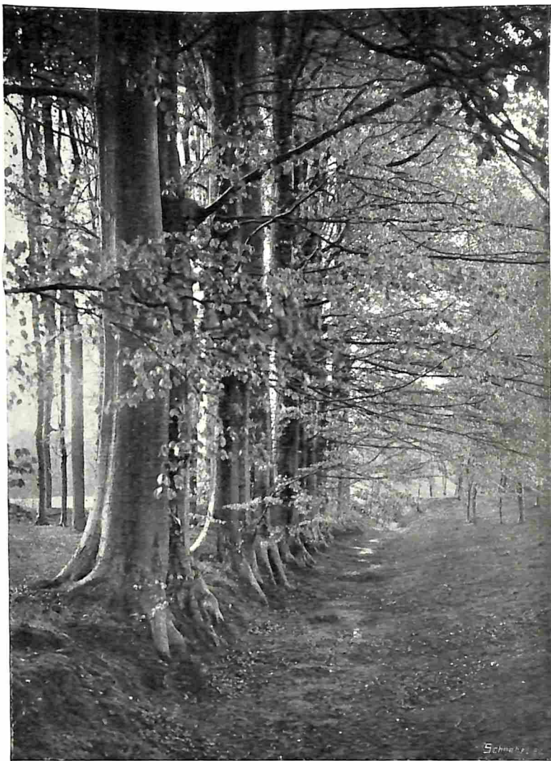
BEUKEN IN DEN HERFST.

Maar — wij vreezen, dat dit nog lang zoo blijven zal. En tot zolang moeten, evenals onze stoffelijke bezittingen gemeenschappelijk worden beschermd door onze wetgeving en hare dienaren — ook onze geestelijke bezittingen gemeenschappelijk beschermd worden. Ja, van nog veel meer beteekenis is dit. Want van geestelijke waarden genieten duizenden menschen, duizenden worden door haar tot leven gewekt en gevoed, van geslacht op geslacht. Hoevelen hebben niet genoten, werden niet ontroerd, sinds eenige eeuwen, door de goddelijke schoonheid eener Middachter Allee, eener Spanjaards-