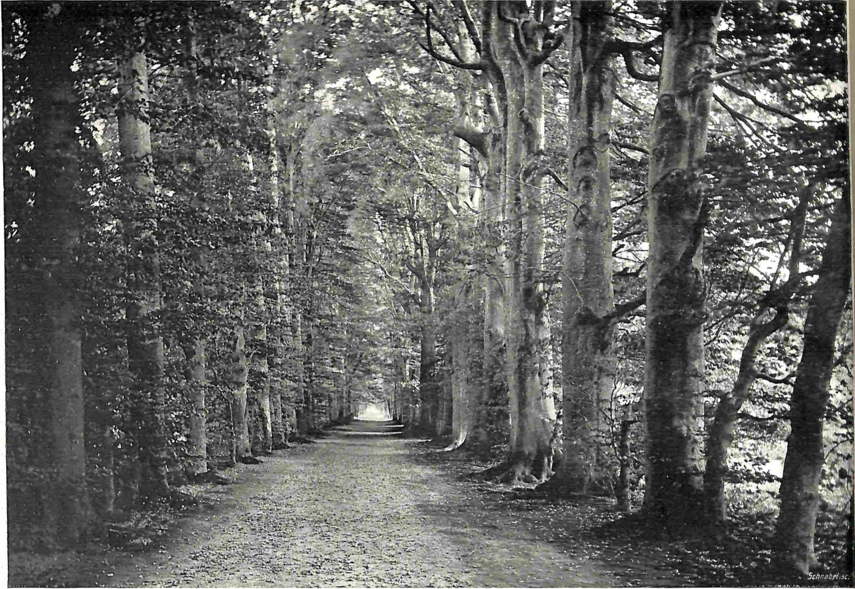
LAAN OP „LAARWOUD” BIJ ZUIDLAREN.