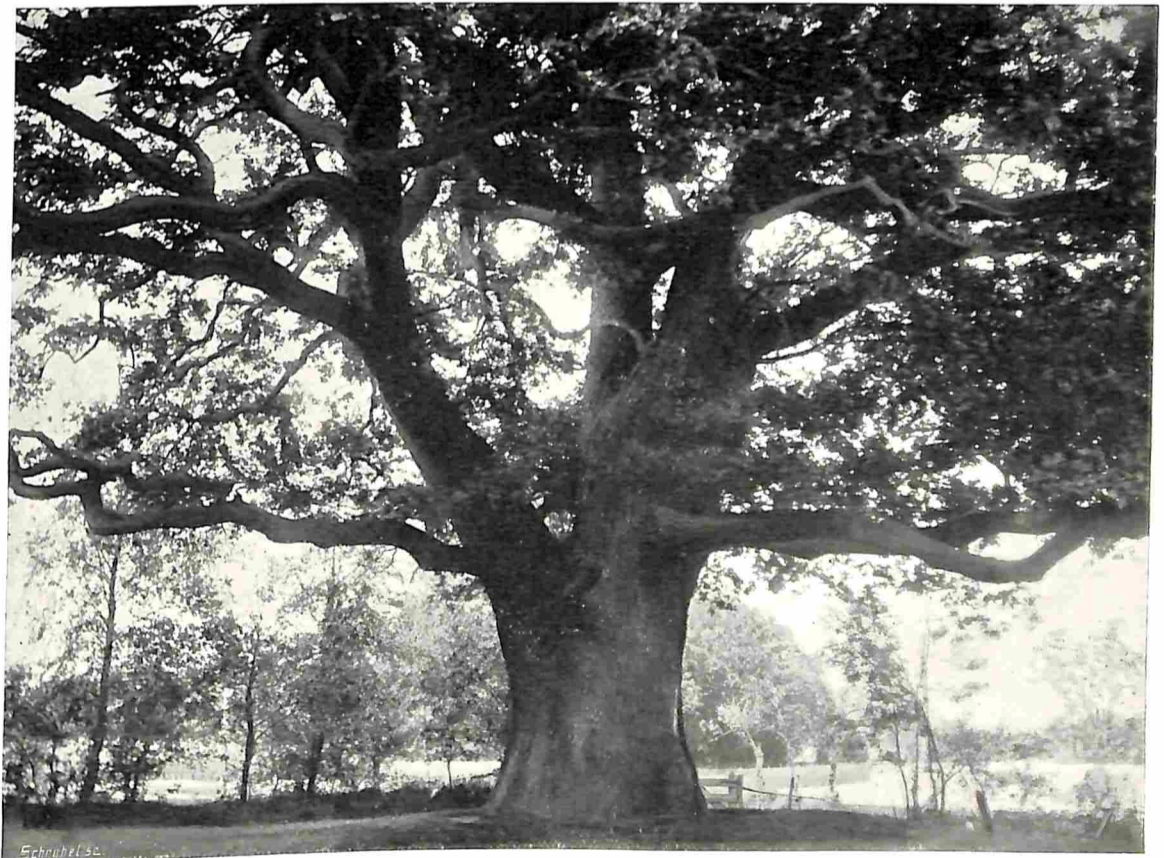
DE OUDE EIK BIJ CARELSHAVEN, DELDEN, ALYSSA.

Waarom moeten zulke mooie natuurstreken door industrie worden in beslag genomen en bedorven, terwijl er voor de woningen der menschen nieuwe plaatsen moeten worden ontgonnen, waargeen natuur-schoon aanwezig is en met veel moeite en kosten toch niet bereikt wordt wat men elders om niet heeft?