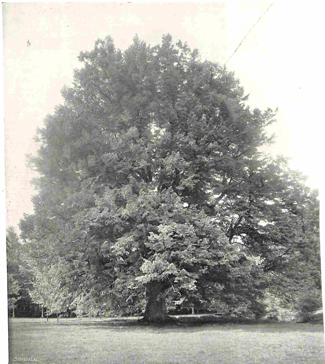
DE KONING WILLEM-LINDE IN HET PARK VAN SOESTDIJK.

En is dit alles niet een bespottung voor onze beschaving, voor onze maatschappelijke orde, voor onze wetgeving en rechtspraak, die wel ruwe materie beschermt en diefstal of verminking daarvan straft met vrijheidsberoving — doch die beschadiging, verminking of vernietiging van hogere, geestelijke waarden toelaat niet alleen, maar zelfs geen enkel protest laat hooren bij het bedrijven daarvan?