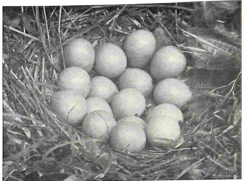
NEST MET EIERN VAN HET WATERHOEN.