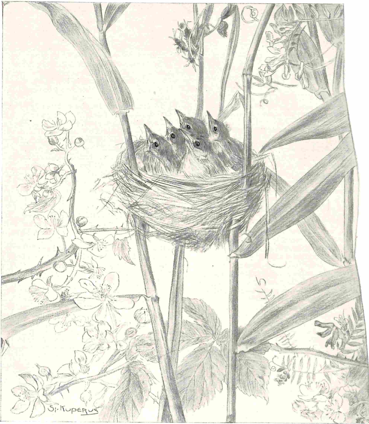
VAN NESTEN EN EIERN. NEST MET JONGEN VAN DEN BOSCHRIETZANGER. Naar de teekening van Sj. Kuperus.