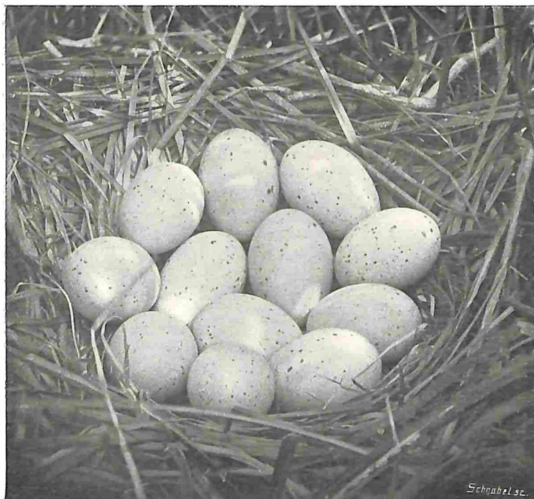
[NEST MET EIERN VAN DE MEERKOET.