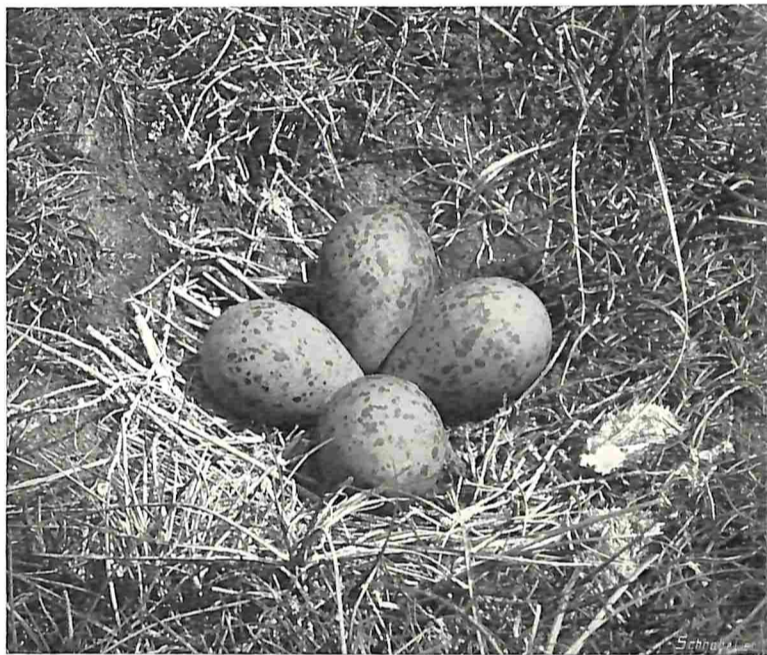
NEST MET EIERN VAN DE KLUIT.

Het frame hing om den hals van een al te nieuwsgierigen slagersjongen, de wielen waren circa een K.M. in tegen-gestelde richting weggehoepeld. Het zadel was door het open raam in het salon van den dokter terecht gekomen en in mijn linkerbroekzak ontdekte ik de bougie. Doch van den