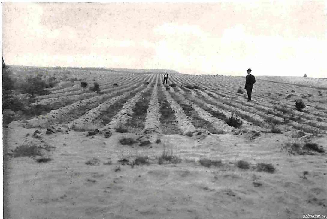
HET SPELDERHOLT. VOORTJES SPITTEN.

aardige wijze opgelost. Zij past n.l. aanstonds den voorbouw toe, d.w.z. een rationeele bemesting gevolgd door het uitzaaien van de aan stikstof rijke lupine, die na den bloeitijd onder den grond wordt gespit. Vervolgens wordt op deze terreinen een- of tweemaal rogge verbouwd, waarvan, bij niet te slechten grond, de opbrengst meestal zoo groot is, dat zij de kosten van bemesting en lupine-bouw ruimschoots dekt. De gronden verbeteren hierdoor enorm en de bewerking kost bijna niets. Deze voordeelige methode zagen we bij ons bezoek aan het Spelderholt op vrij groote schaal toegepast en zal in dit jaar op een terrein van 26 bunder worden voortgezet, waarna aldaar eik met grove dennen er tusschen wordt aangeplant.