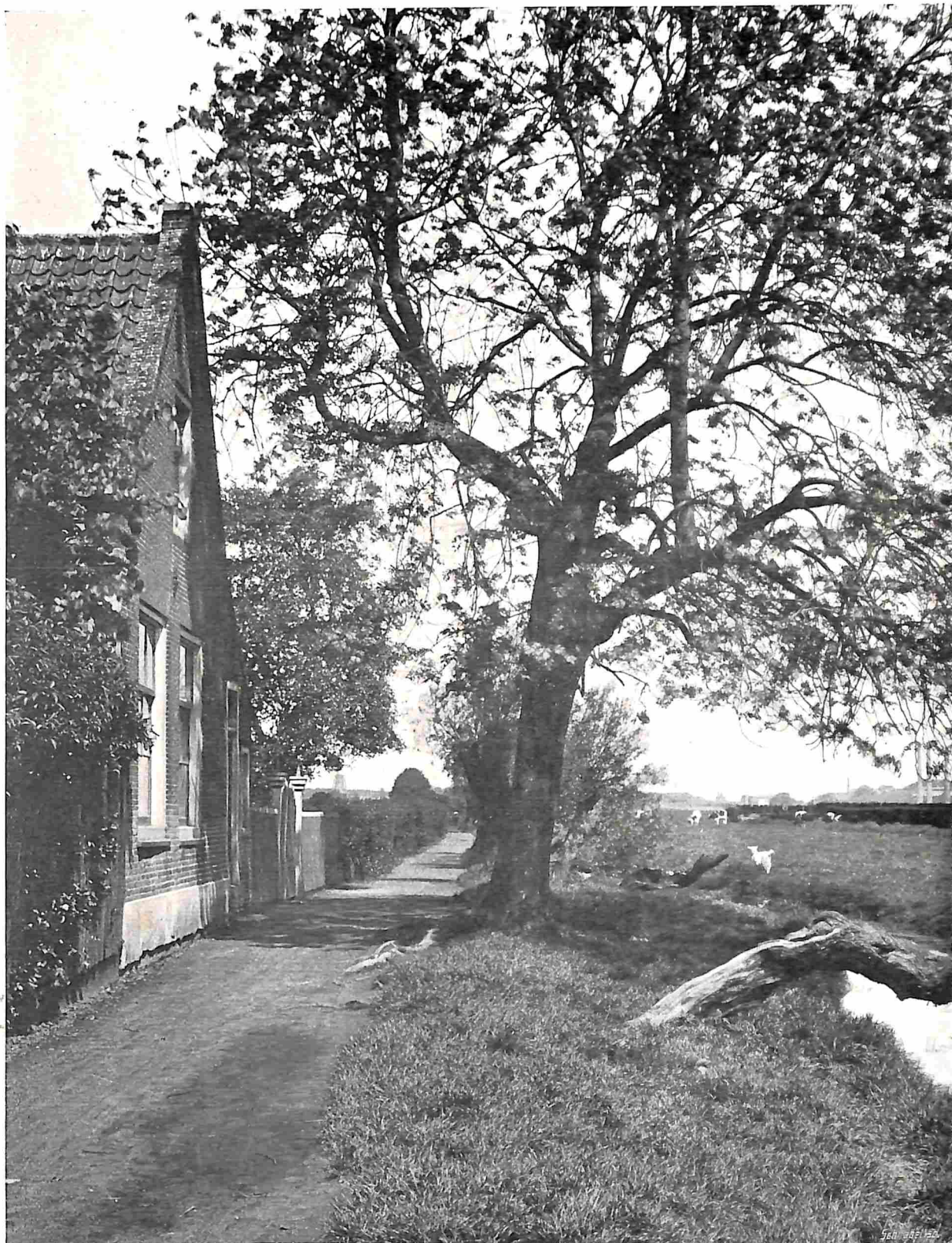
HET SLATUINENPAD TE AMSTERDAM IN HET VOORJAAR.