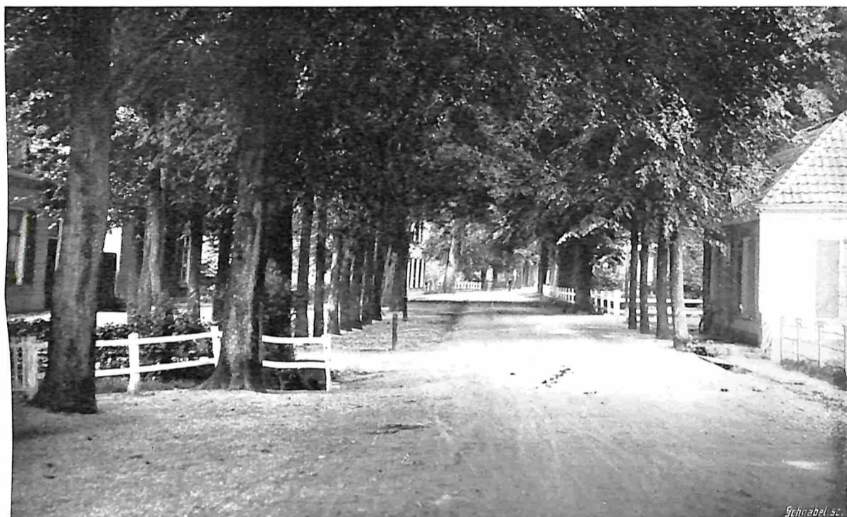
LUNTEREN. IN HET DORP.