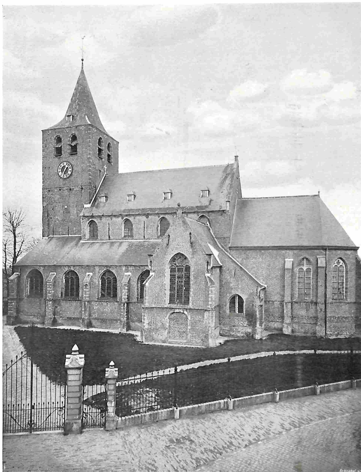
DE ST. QUIRINUSKERK TE HALSTEREN (N.-B.)

Het Bureau ter bewaring van Monumenten van Geschiedenis en Kunst heeft plannen in bewerking dit kerkgebouw met Rijkssubsidie te restaureren en alzoo dit 14e-eeuwse monument aan de hand des sloopers te onttrekken.