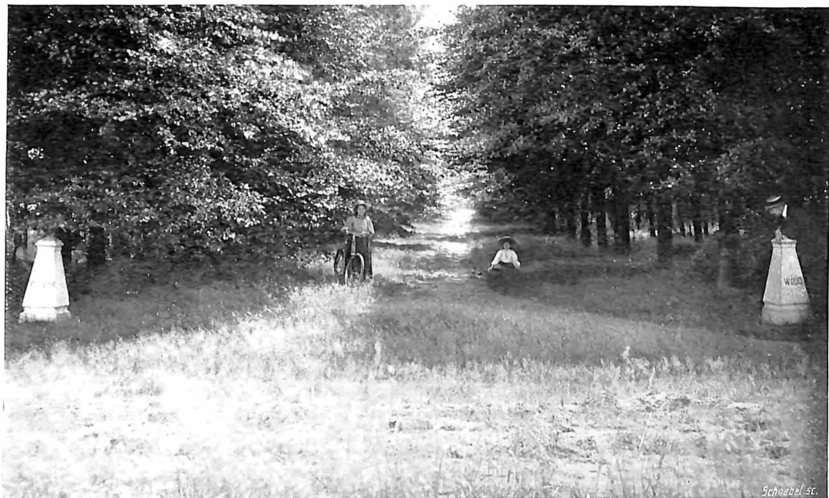
LUNTEREN. INGANG VAN HET FISLERWOUD.

Een zeer aanbevelingswaardige wandeling is die naar den koepel of bevelidère. Voor eenige jaren was deze uitzichtstoren nog slechts een klein gebouwtje, maar door de goede zorgen