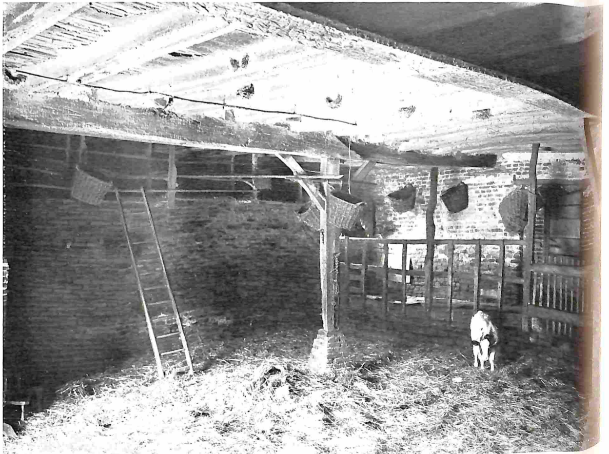
OUDE STAL VAN DE STEINHAAG (L.).

Veel is er aan het oude gebouw moeten gebroken worden en gekapt in de dikke, oude muren om er een boerderij van te maken, maar evenals bij Westring (Maasbree) kan men hier met één oogopslag de oude regelmatige indeeling zien, zelfs nog op de afbeelding, waarop ook de ouderwetsche put nog voorkomt. De stal, waarvan hier ook eene afbeelding getoond wordt is er een, zooals men die in de oude tijden aanlegde, een stal om mest te maken, met lage zoldering, waarbij het licht door de schuurdeur inkomt en volstrekt geen Hollandsche stal. Voor een schilder een fraai geval. Hij dateert nog uit de dagen, toen