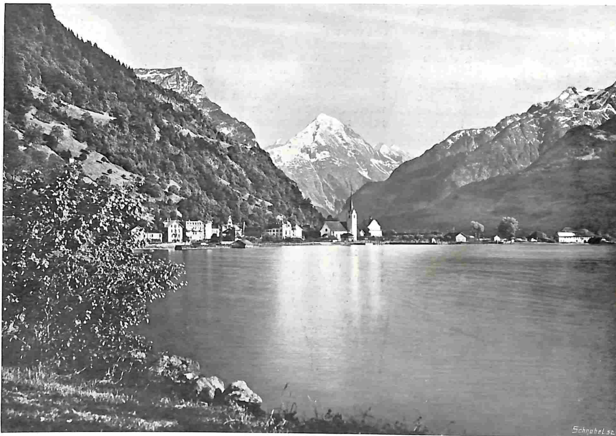
FLUELEN, HET EINDE DER VIERWALDSTÄTTERSEE, WAAR DE ST. GOTHARDBAHN EEN AANVANG NEEMT.

Want in de laatste jaren zijn naar vele hoge bergen, men kan bijna zeggen, sedert men ook den Jungfrau op dusdanige wijze trachtte te beklimmen, naar alle hoge bergen zahnradbahnen gelegd, en toch, hoewel daartoe ongetwijfeld voor den toerist schonere en wijdere uitzichten zijn verkregen, dan dat hetwelk de Rigi geven kan, is de opgang naar den Rigi gebleven wat deze altijd geweest is, en is een bezoek aan zijn top blijven behooren tot het beste programma der reizigers. Eerst in de achttiende eeuw wordt melding gemaakt van zijne bestijging, doch 't was pas na het vredescongres van