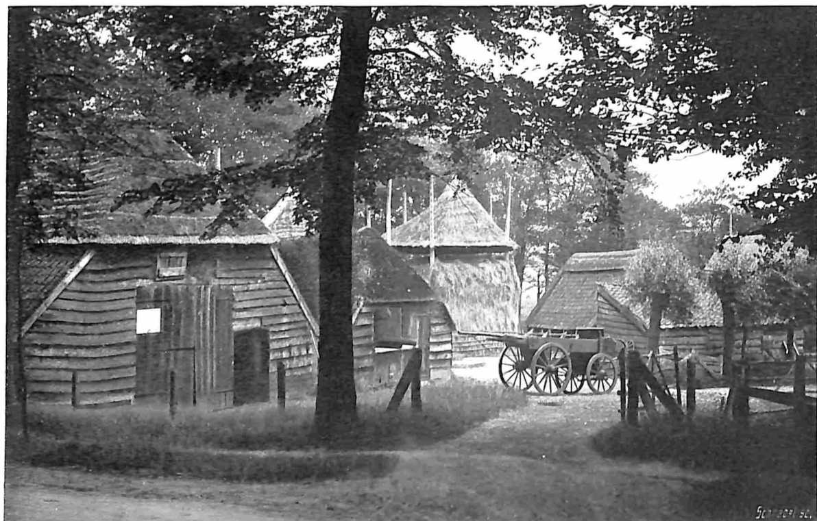
LUNTEREN. EEN TYPISCH-GELDERSCHE BOERDERIJ.

trekkelijkste punten van de streek. Men volgt de beschaduwde Sanatoriumlaan tot bij den ingang van het Fislerwoud, waar