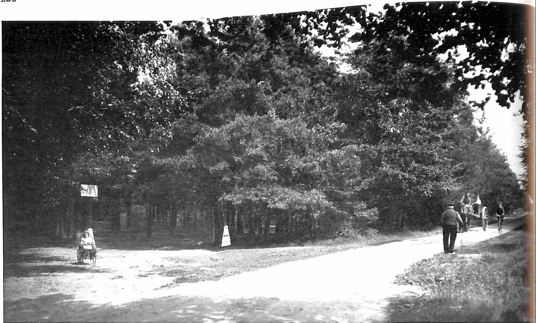
LUNTEREN. WEG NAAR HET SANATORIUM.