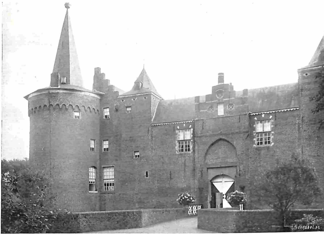
HET KASTEEL HELMOND. DE HOOFDINGANG.