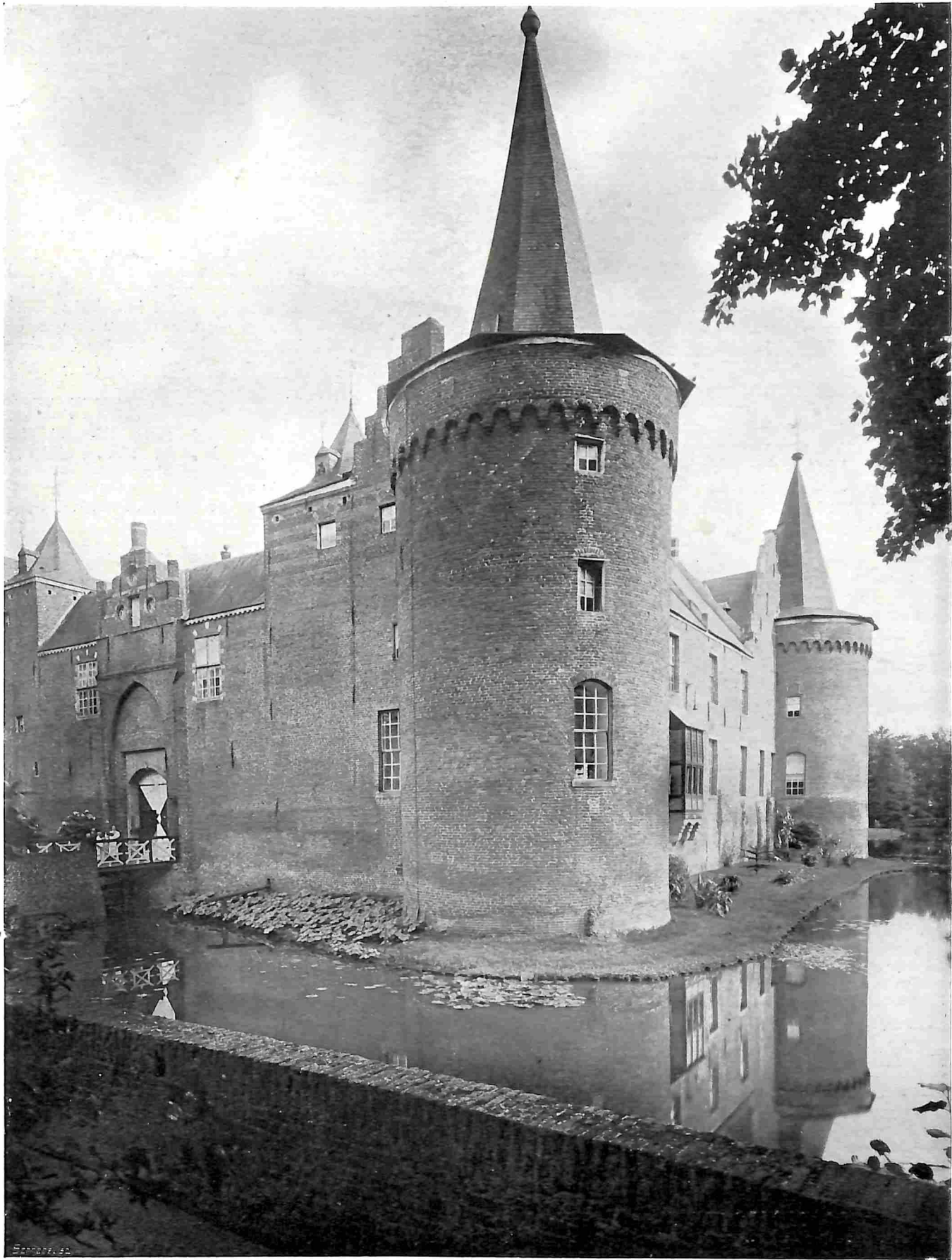
HET KASTEEL HELMOND. - VOORGEVEL EN RECHTERVLEUGEL.