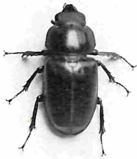
HET VLIEGEND HERT. VROUWELIJK EXEMPLAAR.