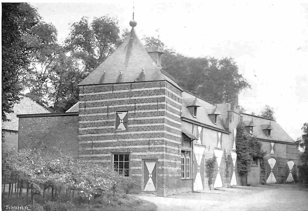
HET KASTEEL HELMOND. WACHTTOREN EN STALLEN.

Het carillon begon te spelen, klinkklaar sprinkelend uit het klokkehuis en het leek, of dat een oogenblik rust gaf, want de sperwer zat ineengedoken en de ratten waren weg. En ook toen de groote klok langzaam acht slagen sloeg, bleven de ratten weg en de sperwer, turend, zag door de spleten der ballustrade ver