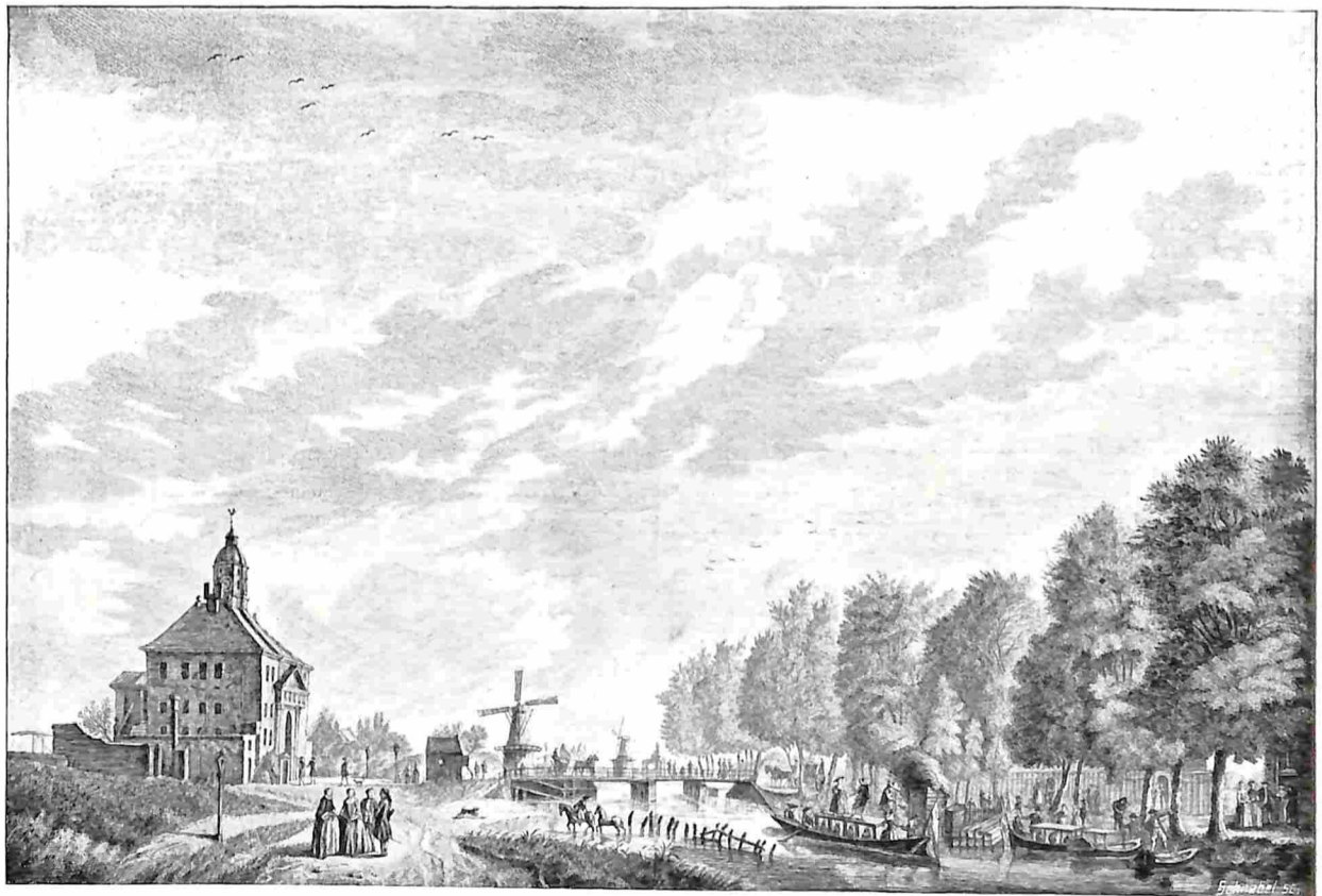
MUIDERPOORT. Naar een oude gravure

Hier, aan den Zeeburgerdijk, zijn we onze wandeling langs den stadselfkant grootendeels ten einde. De gemeentelijke grens