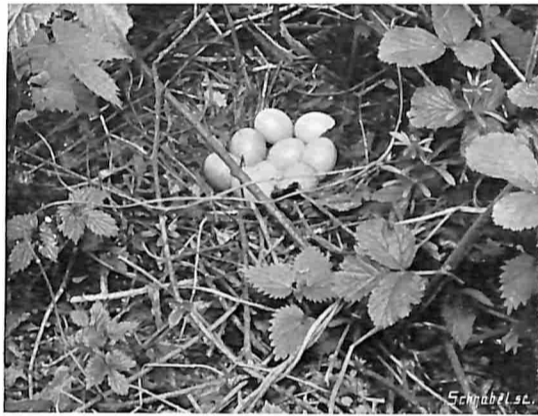
NEST VAN DE BOSCHFAZANT.

We kunnen hierop echter niet wachten en gaan verder. Daar loopen een paar grieto's, statig stappend op hun lange stelten. Hier en daar bemerken we op 't land van die hooge grasboschjes. In zoo'n boschje maakt de grieto zijn vrij diep nest. We doen het best eenige van die grasboschjes na te zoeken. Eindelijk, ja wel, daar vinden we