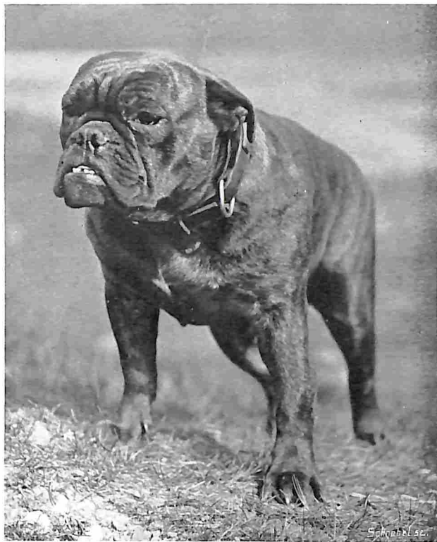
LORD CHANCELLOR, WINNER VAN 50 EERSTE PRIJZEN.