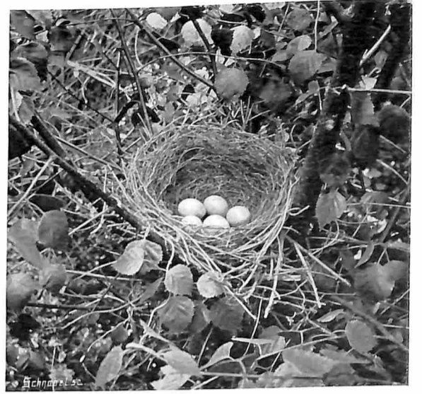
NEST VAN DE VLAAMSCHE GAAL.

een nest, diep in zoo'n grashoepje, de lange, droge grashalmen vormen er boven een gewelf. We buigen het gras op zij en vinden één ei, grooter dan dat van een kievit, mestgroenachtig met groote grijze vlekken. Een „broed” (3 stuks bij grieto's) zullen we niet gemakkelijk vinden. De grieto begint pas eind April met het leggen der eieren, later dan de kievit.