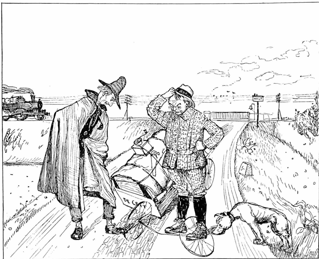
DE RAADSELACHTIGE EN GRILLIGE ONWIL VAN „DE WIELEN”.

overvallen. Geen nood. Hij leeft. Onze gast is alleen maar gekomen met vier zoons. Hen dacht ik de vrijbuiters. Een heeft een harmonica bij zich. Wij gaan zitten en maken melk met cognac klaar. Verzoeken den Stip te vertellen. Hij zegt niets. Wij drinken. Ook zijn zoons zeggen niets. Zij grijnzen. Wij spelen mandolien. Mijn reisgenoot teekent ze uit. Eén zoon gaat harmonica spelen. 'n Oud wijsje: „Toen ik op Neerlands bergen stond”. Repertoire is uitgeput. De muziek ook. Eindelijk zeggen ze wat. Dat ze heen gaan. We zijn beteuterd, zeggen hen goeden dag en hebben nog lang gedacht over de wijsheid van 't Volk der Veluwe.