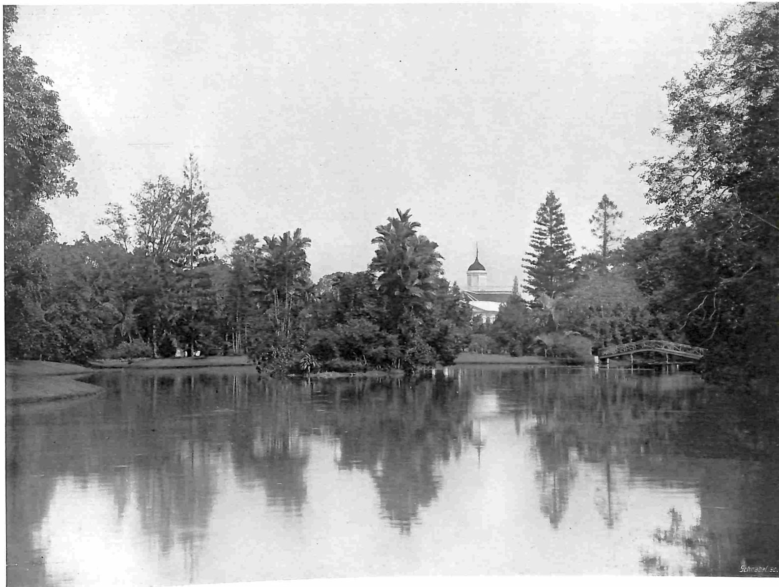
BUITENZORG. IN HET PARK.

„Kijk, daar steekt iets donkers met een klein pluimpje boven 't gras uit. 't Is een kievit, rustig zittende op zijn nest. ¶ Een eindje verder staat een andere kievit, 't is de „ald hy”, het man-