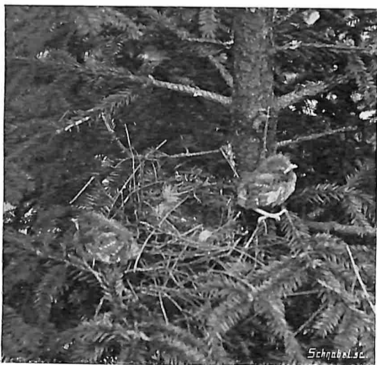
JONGE BASTAARD NACHTEGALEN.