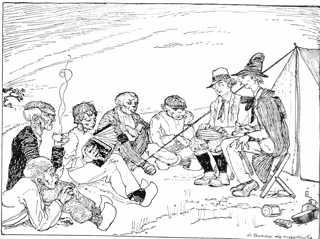
HET RUSTIGE GEZELSCAP VAN „DE STIP” EN ZIJN WAKKERE JONGENS.