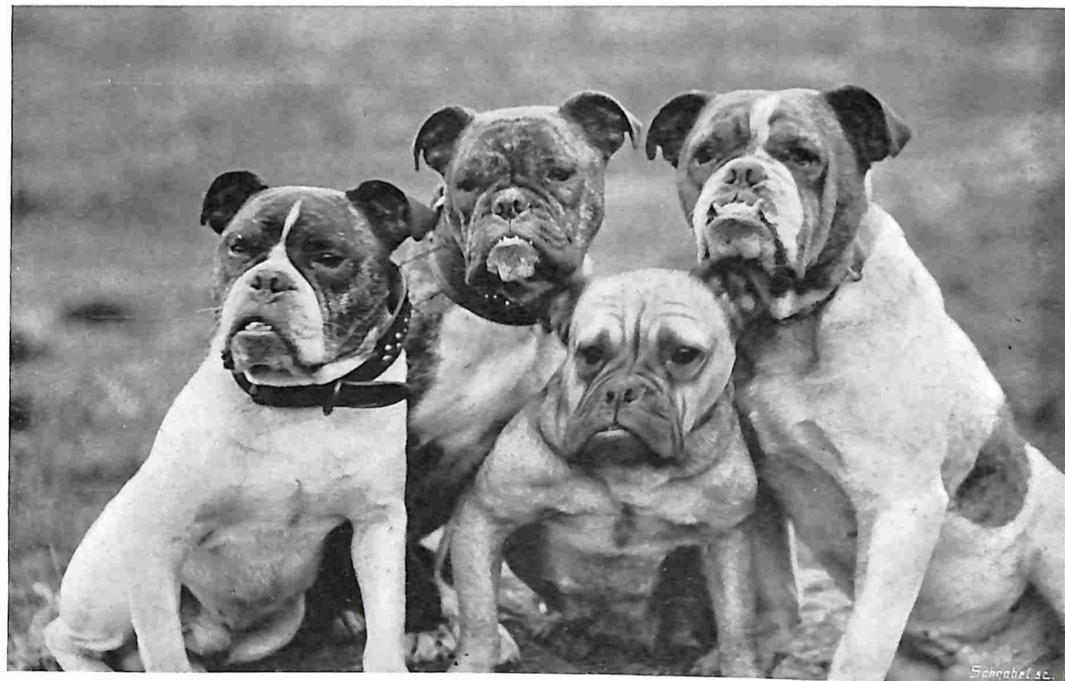
EENIGE BEROEMDE ENGELSCH BULL-DOGGEN.