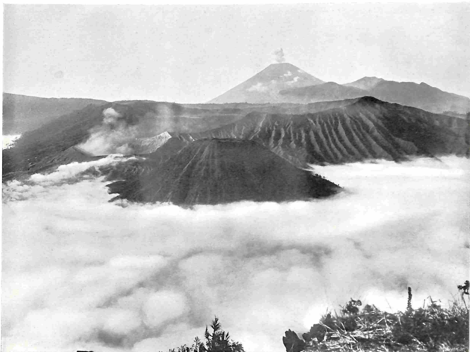
ZANDZEE IN NEVELEN. OP DEN ACHTERGROND DE ROOKENDE SMEROE.

slag van zwavel. Uit den hoofdschoorsteen verheft zich met korte tusschenpoozen, bruischend en sissend, een rookkolom, die zich boven den kraterwand uitbreidt. De afwezigheid van plantengroei, de gapende afgrond, de dorre Dasar geven de omgeving eene uitdrukking van geheimzinnigheid, angstwekkend en grootsch. Heel het uitzicht rondom werkt er toe mede om den indruk te verhoogen. Scherpe oogen ontdekken nieuwe vuurbergen. Ver in het Oosten de rookende kegel van den Lamongan, Zuidwaarts de rookzuil van den Smeroe, ten N.W. den kegel van den Penangoengan, ten W. de kruinen van den Ardjoeno, en heel in de verte ten Z. den kegel van den Keloet. Waarlijk, men waant zich het gebied van Vulcanus te hebben betreden, ver buiten de wereld der menschen. Al die werkende kegels gelijken op reuzenaltaren, waarvan de rook hoog boven de wolken opstijgt.