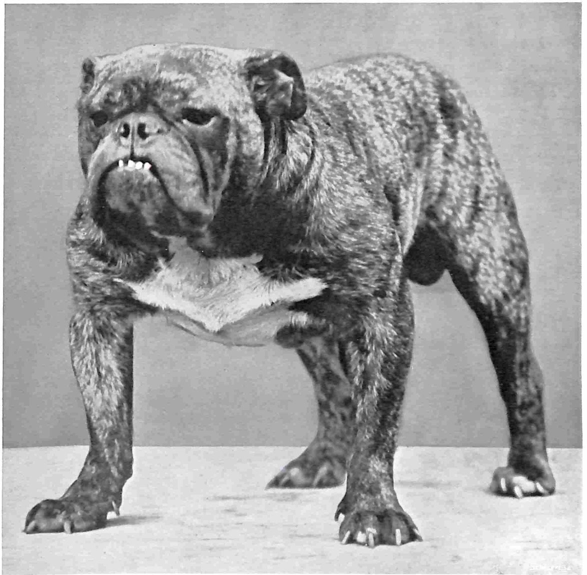
RODNEY STONE, WERD VOOR £ 12.000.— NAAR AMERIKA VERKOCHT.

In Engeland heeft men dwerg- of toybulldoggen, die precies gelijken op de groote exemplaren, doch niet zwaarder mogen