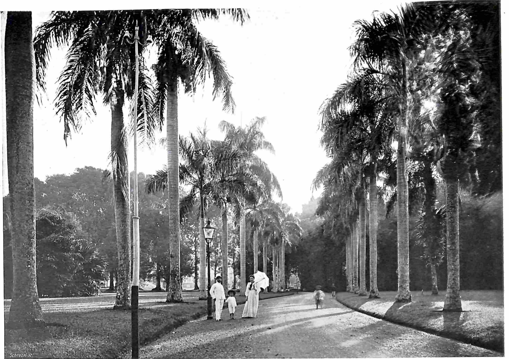
BUITENZORG. IN HET PARK.

schemer. Als krachtige woudreuzen staan daar die geweldige waringins. De takken hebben luchtwortels neergelaten die in den grond zijn gedrongen en den stam hebben omstrengeld, zoodat die op een vlechtwerk van takken gelijk; andere luchtwortels zijn verder van den hoofdstam in den grond geschoten en vormen bijstammen, dik als zware orgelpijpen; het lijkt wel of zij de reuzenloofkroon willen stutten. Hoe begrijpelijk, dat de inlander zijn stille gewijde plekjes heeft, diep overschaduw door den machtigen waringinboom, die zoo beschermend zijne takken spreidt.