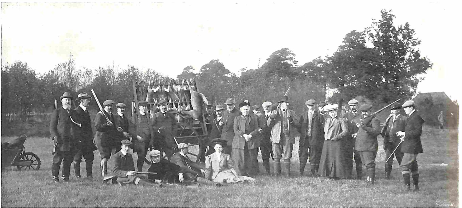
GROEP VAN ALLE DEELNEMERS AAN DE DRIEFJACHT, GEHOUDEN DEN 9 en NOVEMBER ONDER VERWOLDE; MET ENKELE DAMES ALS TOESCHOUWSTERS.

Dat zijn de gespannen momenten en wanneer hij nu een haas in volle vaart op zich ziet afkomen of door zijn veerkrachtigen