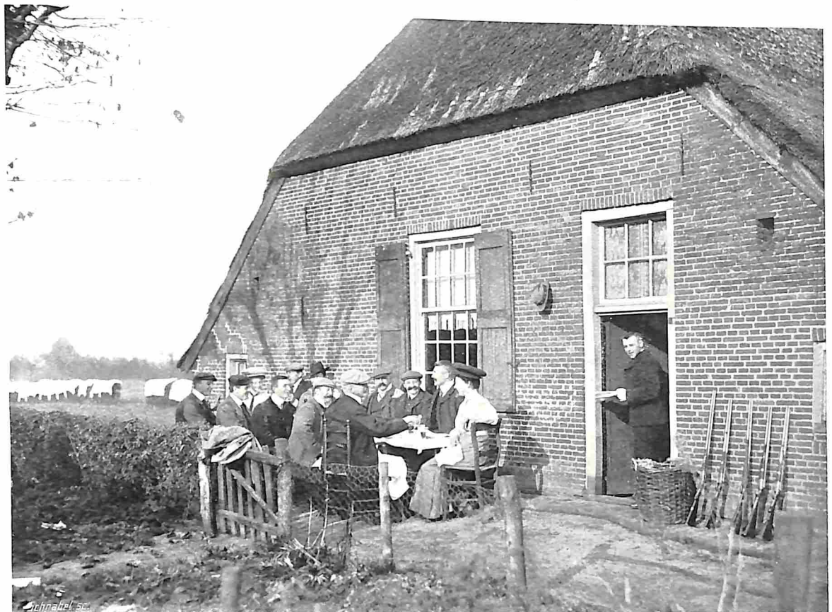
HET JACHTDEJEUNER OP EEN BOERDERIJ. Wegens het mooie weer verkoos een gedeelte der deelnemers buiten, voor de boerderij, te dejeuneren.

Ziedaar eenige jachtresultaten, waaraan ik dacht, sprekend van het tableau na afloop van de jacht.