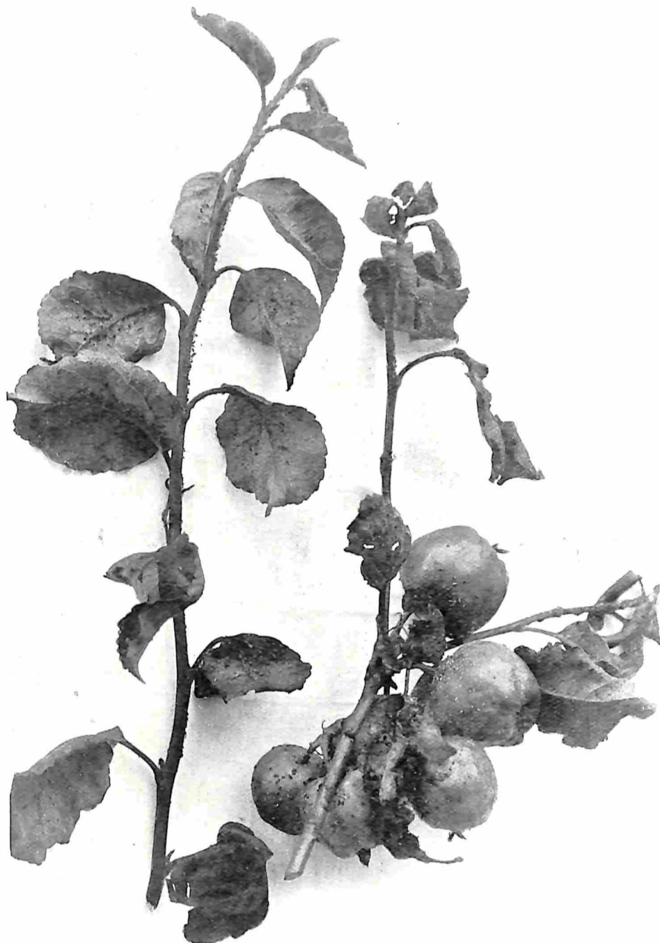
GROENE APPELBLADLUIS, OOK DE VRUCHTEN ZIJN AANGETAST.

Op de foto van den tak met Bloedluizen bezet, bespeurt de aandachtige lezer ook het spinsel van de Spinselmot ( Hyponomeuta malinella ), een geduchte vijandin van den appelboom. Zij behoort tot de Vlinders ( Lepidoptera , Glossata ). De Spinselmotten hebben aan weerszijden van den kop een paar uitstekende tasters . De kleur van het aardige vlindertje is wit met zijdeachtigen glans. Op de voorvleugels loopen drie overlansche rijen zwarte stipjes. Ook rug en schouderdeksels zijn gestipt. De achtervleugels zijn donkergrijs met een lichtgrijze franje. De slanke, grijze, met zwarte wratjes bezette rupsjes leven heel gezellig en prettig bijeen in een kleverig spinsel. Zij voeden zich met de zachte deelen van bloemen en bladeren, niets overlatende dan de nerven en een der dekzijden. Naarmate zij meer behoefte hebben breiden zij hare gemeenschappelijke woning uit, zoodat de geheele tak als met een gewezen deken bekleed is. Is deze geheel afgeweid, dan zoeken zij een nieuwe woonstee op. Vandaar dat men haar in Gelderland trekmade noemt. In dit spinsel verpoppen zij zich in een haverkorreligen cocon. In den zomer legt het motje zijne eitjes in hoopjes op een blad bijeen. Gelukkig verschijnt maar één broedsel per jaar. In den herfst komen de rupsjes te voorschijn; doch zijn dan nog niet gevaarlijk. Dit worden zij eerst, wanneer zij hun