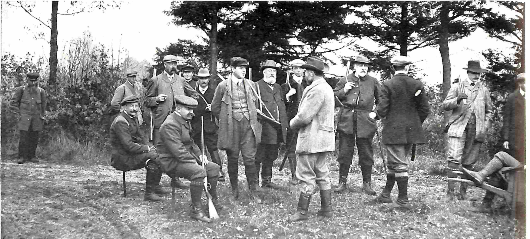
GROEPJE SCHUTTERS NA AFLOOP VAN DE DRIFT, WACHTEND OP DEN WILDWAGEN.