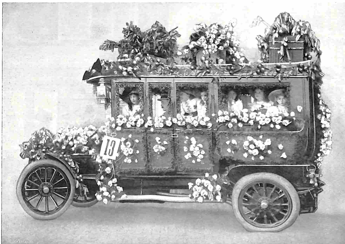
REISWAGEN MET WITTE ROZEN EN ORANJEAPPELEN OP DE IMPERIAAL REISMAND EN RESERVEBANDEN.

Onze eerste foto is een reiswagen F.I.A.T. van de firma Verwey en Lugard, prachtig versierd door de firma „Corona“ te Amsterdam, de tweede een Victoria van dezelfde firma ook met versiering van „Corona“.