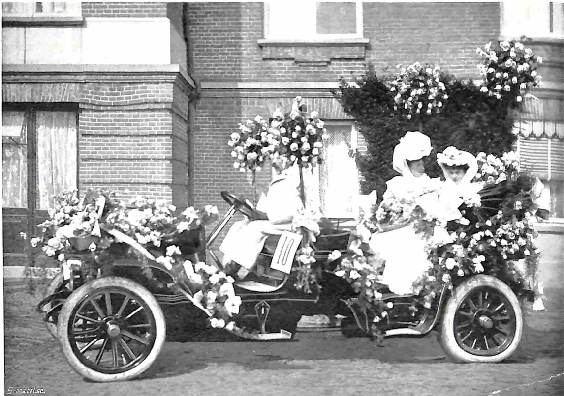
VICTORIA-AUTO MET ROSE ROZEN.

Of de zomerzon hem beschijnt en 't knettert in zijn blauwe kroon, dat de kegels openspringen en de zaden rondom u vliegen als kleine bruine duizelige vliedertjes —, óf dat de wintersneeuw