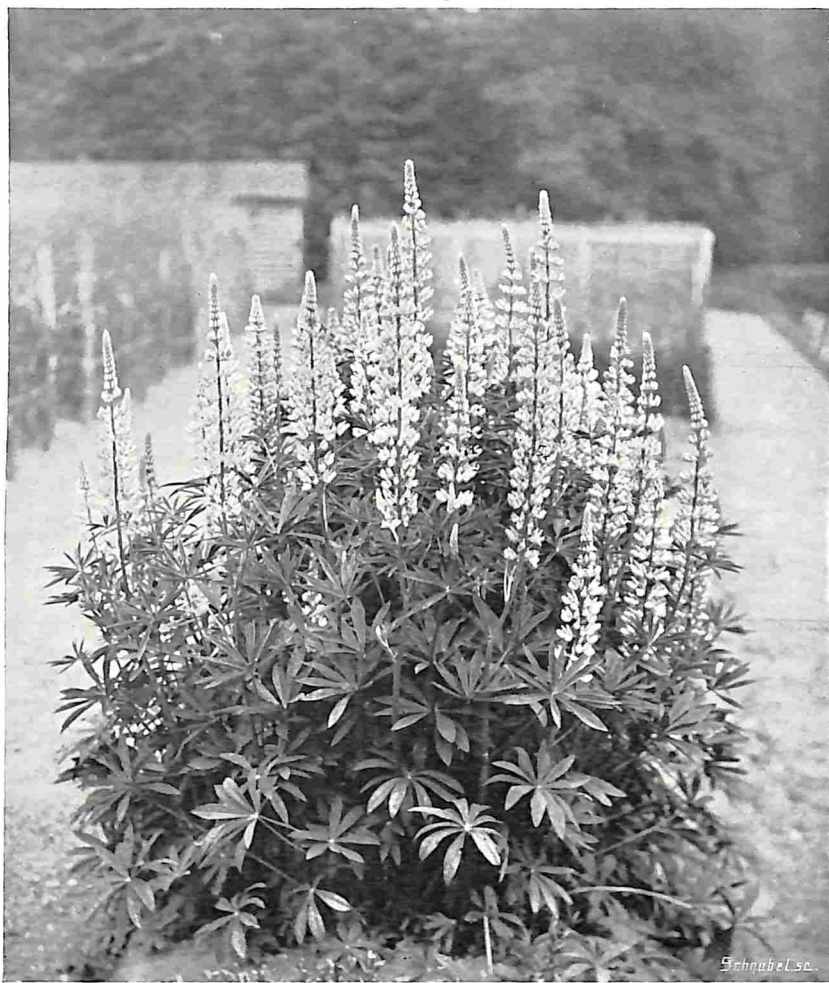
LUPINEN. ( Lupinus polyphyllus Dougl.)